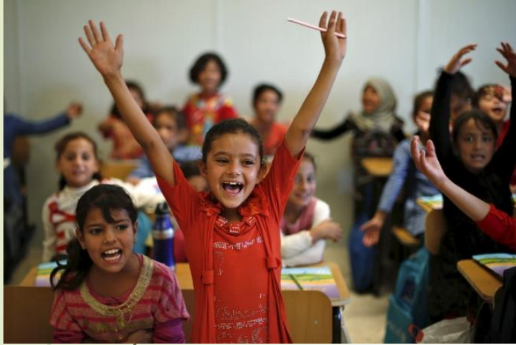
Ankara'da okula başlayan Suriyeli çocuklar